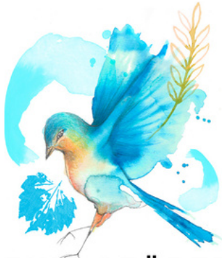
HEINZ STÖRZEL www.weingut-stoerzel.de

SAMTAGS UM 14 UHR, 29.04.2023 + 06.05.2023 + 27.05.2023 + 10.06.2023 + 24.06.2023 + 16.09.2023 + 07.10.2023 + 21.10.2023