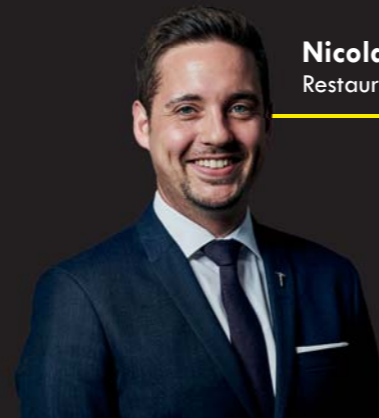
Nicolas Spanier Restaurant Tantris

Drei Münchener Wein-Freaks freuen sich auf einen Sommerabend mit Euch bei der 1. Sturmfreien Weinbude mit 15 JungwinzerInnen der Generation Riesling.