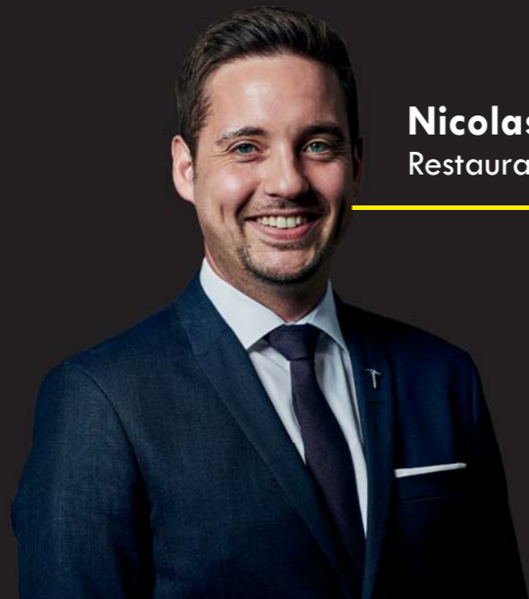
Nicolas Spanier Restaurant Tantris